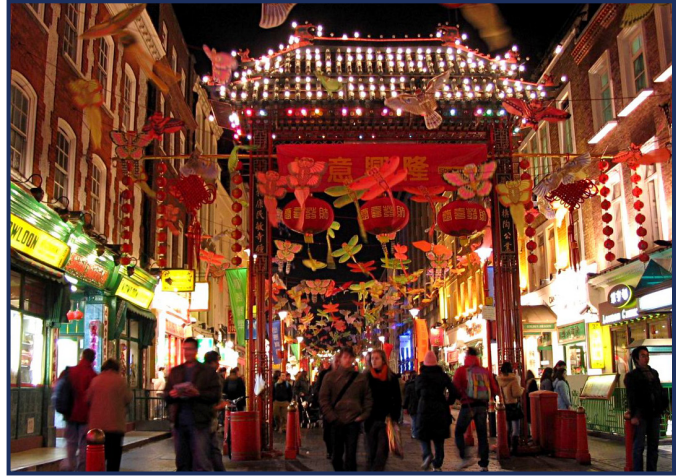
캘리포니아 샌프란시스코 차이나타운

힐우드의 일반 파트너들 역시 상당한 수익을 실현하였습니다. 그 기반 프로젝트인 얼라이언스 텍사스 (Alliance Texas)에서 힐우드는 1990년 이래로 220개 회사를 유치하여 28,000개의 일자리를 창출하고 3천 백만 평방 피트 이상을 건설하였습니다. 텍사스 주의 포트워스 (Fort Worth) 시 및 연방항공국 (Federal Aviation Administration)으로부터의 약 1억달러의 최초 공공 투자는 이미 민간 투자에서 68억 달러의 수익 및 7억 3천만 달러의 부동산 세금 수입을 발생시켰으며 이 중 2008년 한 해 동안 부동산 세금 수입은 총 1억 5백만 달러였습니다.