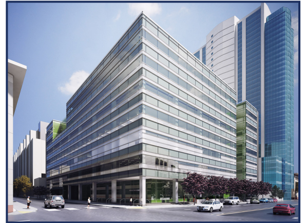
퍼시픽 대학교 아서 에이 듀고니 치과대학의 완공시 예상도

개발 계획에 해당하는 부분들에 집중할 것입니다. 힐우드는 궁극적으로 샌프란시스코 시 내에 소재한 10개의 다른 상업지구 및 주거지역 현장을 개발하고자 합니다. 그러한 시설에 대한 샌프란시스코 시장은 높은 수요가 있으며 특히 분양판매형 콘도미니엄 개발의 공급이 부족한 상태입니다. 궁극적으로는, 힐우드와 트루마크의 샌프란시스코 시 및 카운티 내에서 완성될 순차적 개발 프로젝트로 인하여 수천 제곱피트에 달하는 개조형 사용전환 상업 및 신 주거 공간이 탄생될 것입니다.