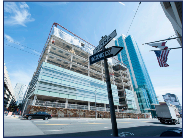
미래의 아서 에이 듀고니 치과대학에서 진행되는 현재 공사 활동

그룹 18 파트너십은 캘리포니아 시 및 카운티에 소재한 1개의 상업용 개조형 사용전환 재개발 프로젝트 및 3개의 주거지 개발 프로젝트에 초점을 맞출 것입니다. 이 프로젝트들의 첫째 사업은 예전의 상업용 빌딩을 퍼시픽 대학교 아서 에이 듀고니 치과대학으로 재개발 하는 것입니다.