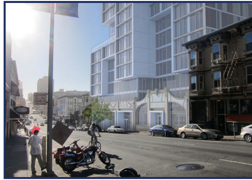
파인스트리트 개발 완료 후 보행자 눈높이 예상도

마지막으로, 힐우드 및 트루마크는 현재 그 명칭을 “놉힐 웨스트 타워”로 하게 될 예정인 다층 주거지 개발 주요 프로젝트를 수행할 것입니다. 이 프로젝트는 샌프란시스코의 가장 활발하고 이상적인 지역인 놉힐의 반네스 애브뉴와 포크 스트리트 사이에 위치한 콘도미니엄 개발입니다. 개발회사는 그 부지를 재개발하고 123개의 주거 콘도미니엄을 이전할 것을 목표로 하여 총 15,030 제공피트에 달하는 5개의 연속 필지를 매입할 수 있는 24개월 옵션 계약을 확보하였습니다.