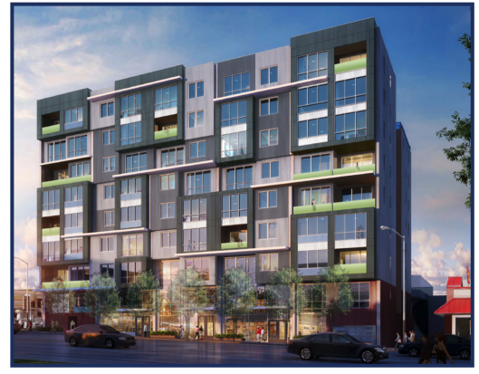
캘리포니아 샌프란시스코 포르테로 346번지에 위치할 미래 개발될 콘도미니엄의 보행자 눈높이 예상도

그룹 18 자금은 기존 현장 구조의 철거, 수평적 인프라 개선, 수직적 건설 및 시설의 주거 및 소매 영역의 완성 등을 포함하는 프로젝트의 건설활동에 직접 활용될 것입니다. 프로젝트의 필요한 완전한 허가 완료는 2013년 제 4분기로 예상되며, 건설의 완료는 2016년 제 2분기로 예정되어 있습니다. 포르테로 프로젝트의 총 건설 비용은 약 6천 5백만 달러입니다.