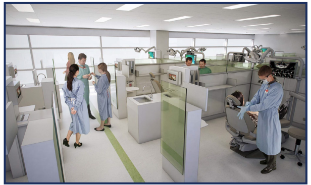
미래의 아서 에이 듀고니 치과대학에 지어질 최첨단 임상 진료시설의 예상도