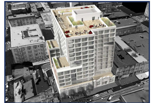
완공 후 파인스트리트 콘도미니엄 건물 및 옥상 정원의 예상도