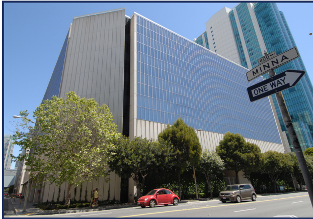
캘리포니아 샌프란시스코 제 5번가 155번지에 소재하는 퍼시픽 대학교 아서 에이 듀고니 치과대학의 미래 현장

힐우드는 캘리포니아 전체에 걸쳐 상업적 경제적 개발에 깊숙이 관여하고 있습니다. 최근, 힐우드는 자신의 파트너인 트루마크와 샌프란시스코 시에서 상업지구 및 주거지 개발 포트폴리오를 허용하는 일련의 계약을 체결하였습니다. 그룹 18 파트너십 프로젝트는 상당 수의 부동산을 대상으로 하는 힐우드와 트루마크의 전반적인