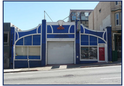
캘리포니아 샌프란시스코 파인스트리트 1545에 현재 소재하는 역사적인 건물 정면의 보행자 눈높이 정면 예상도