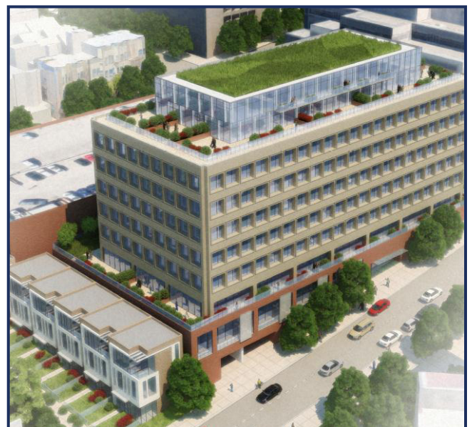
웨스터 스트리트 재개발 완료 후 예상도

이 프로젝트는 현재 7층의 주거용 가구 (총 76개의 콘도형 가구로 구성) 및 2층의 주거 및 상업용 주차장을 포함, 총 9층의 구조로 건설할 것으로 계획되어 있습니다. 완성되면 이 시설은 총 69,725