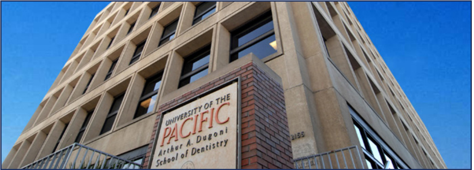
캘리포니아 샌프란시스코 웨스터 스트리트 2155번에 소재하는 기존 아서 에이 듀고니 치과대학

캘리포니아 인프라 프로젝트는 가장 이상적이고 가장 성공적인 지역사회에서도 열매를 맺을 수 있도록 자금에 관한 지원을 필요로 합니다. 이러한 프로젝트들은 직접적인 프로젝트 지역뿐 아니라 많은 다른 지역 출신의 주민들에게 영향을 미칠 것입니다. 경제 분석에 의하면 이 프로젝트는 현재 경제 사정에서 고용 창출을 활성화하기 위하여 도움이 필요한 캘리포니아 주의 많은 지역사회로부터 사람들을 고용하게 될 것입니다. CMB는 새로운 고용을 창출하고 변화를 가져올 투자를 위하여 헌신할 것입니다.